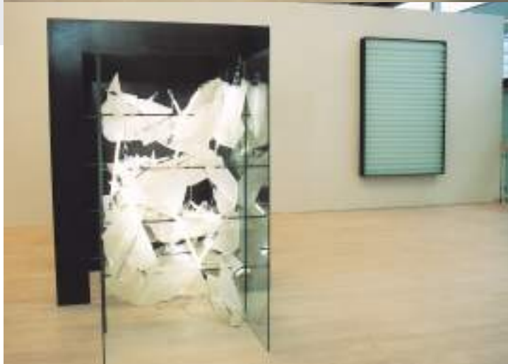
Kat. no. 5, 12