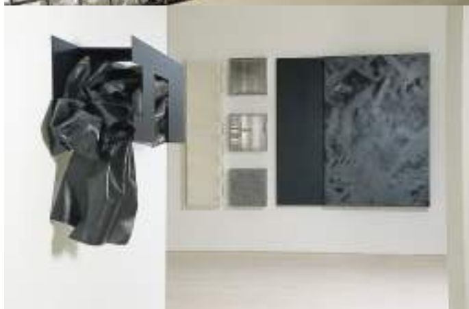
Kat. no. 6, 1