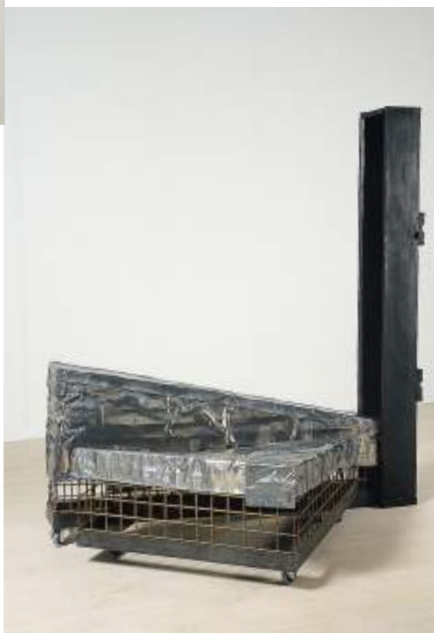
Del af kat. no. 2