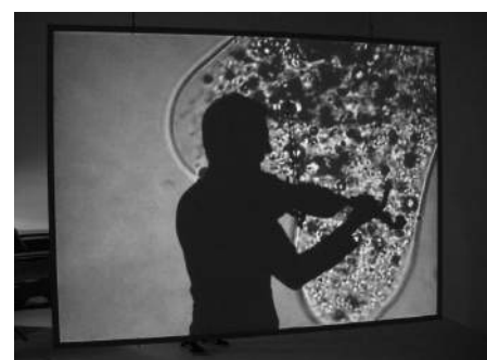
Kultur nat, Den Ny Opera