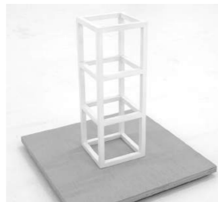
ONE More – In Memoriam Sol LeWitt

One More blev fulgt op af museets egen hyldest til Sol LeWitt i sommerens perspektivering af samlingen, der i år var installeret over de geometriske grundformer: kvadrat, trekant og cirkel. Ikke alene var værkerne valgt ud med disse tre grundformer som optik. De var også hængt op på væggene derefter, tilmed i et sammenhængende og dynamisk forløb af rum, der havde kvadratet, cirklen og trekanten som skabelon. Ledsaget