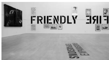
The Map is not the Territory