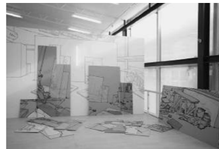
Maleri uden grænser, Peter Nansen Scherfig

Øjenåbnende var også efterårets særudstilling Maleri uden grænser , som med bevidst brug af udstillingsmediet satte fokus på en enkelt kunstart og leverede overraskende