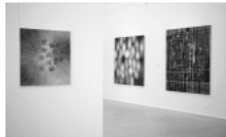
Dialogue with Space