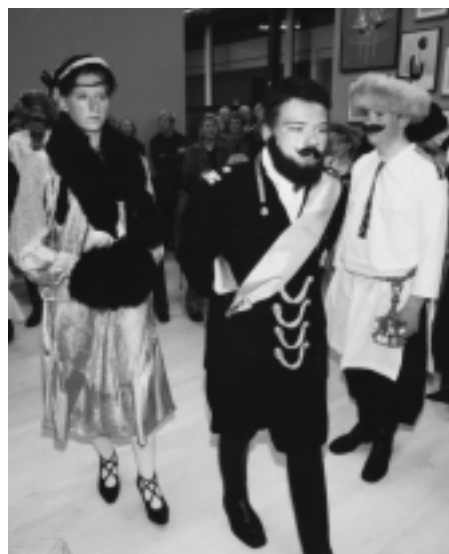
Skt. Petersborg natten