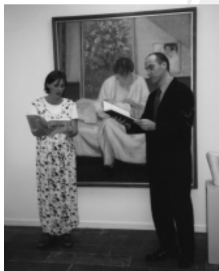
Festugeåbning med Den ny Opera